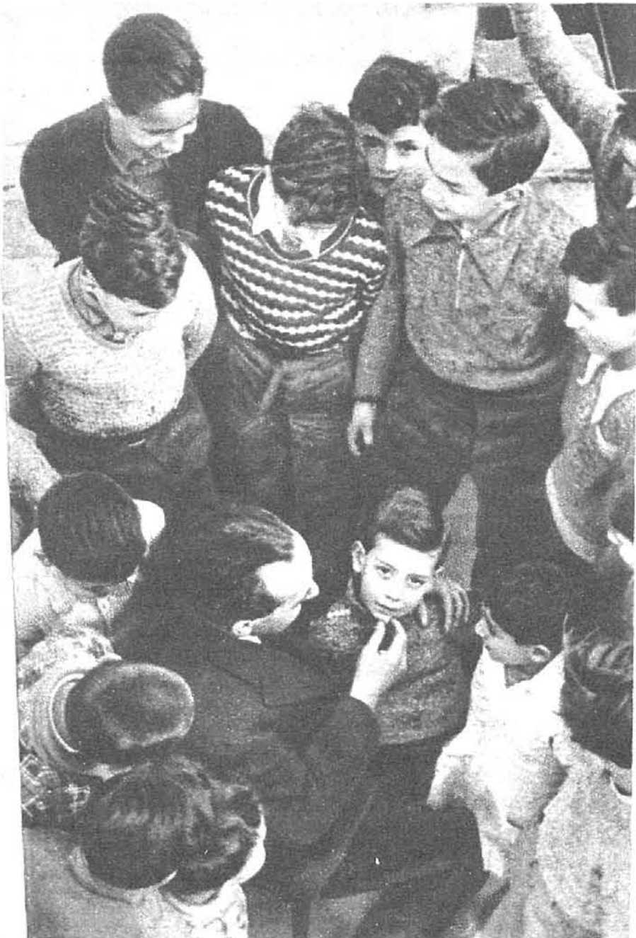
El antiguo maestro pasa ahora todas las tardes en la escuela de Vendrell, que dirigía.

—Vivía al final de las Ventas, en el domicilio de